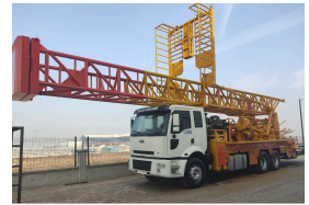
المنتج MS40 (800 M)