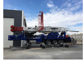
المنتج MS100 (2000 M)