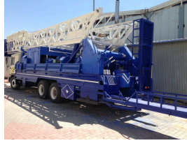
المنتج MS60 (1200 M)