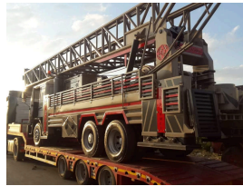
المنتج MS30 (600 M)