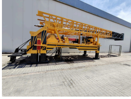
المنتج MS50 (1000 M)