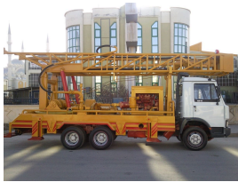
المنتج MS20 (400 M)