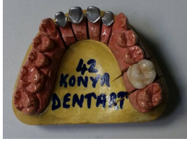
المنتج Diş Protezi