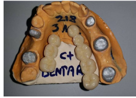
المنتج Diş Protezi