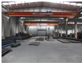
المنتج رافعة سيارة