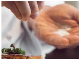
المنتج Sofra Tuzu