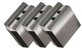
المنتج أقدام عالية ناعمة