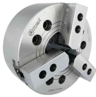
المنتج مرآة هيدروليكية 3 ساق