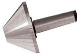
المنتج بت الدقة الأنابيب