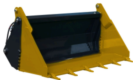
المنتج دلو الأرض المنبثق