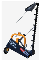
المنتج جهاز مزدوج النصل