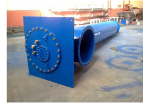
Produkt Ausrüstung für Pumpenstation