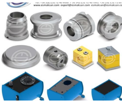
Produkt Hydraulikzylinder Ersatzteil