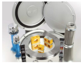
Produkt Hydraulische Öltankzubehörteile