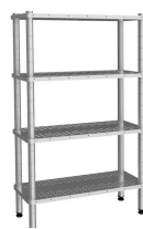
Produkt Perforierte REgale