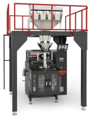
Produkt IM-L LİNEER TERAZİLİ PAKETLEME MAKİNESİ