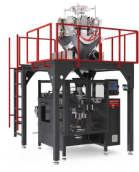
Produkt المقاييس الالكترونية المتعددة W-MI مكينات التغليف ذات