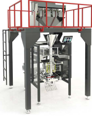
Produkt BM-L Lineer Terazili Paketleme Makinesi