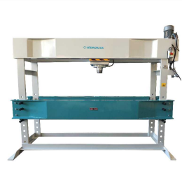
Produkt Hydraulische Werkstattpresse