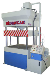
Produkt Hydraulische Pressmaschinen