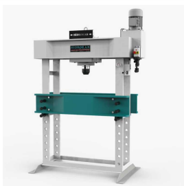
Produkt Hydraulische Werkstattpresse