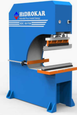
Produkt Hydraulische Pressmaschinen