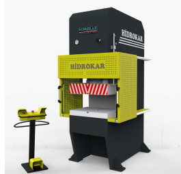
Produkt Hydraulische Pressmaschinen