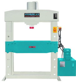
Produkt Hydraulische Werkstattpresse