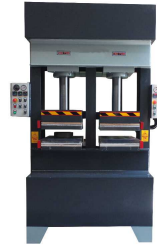
Produkt Hydraulische Pressmaschinen