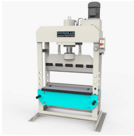
Produkt Hydraulische Pressmaschinen