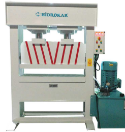
Produkt Hydraulische Pressmaschinen