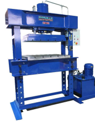
Produkt Hydraulische Werkstattpresse