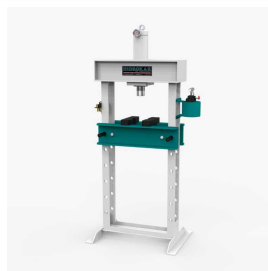
Produkt Hydraulische Werkstattpresse