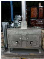
Produkt Ofen, Herd