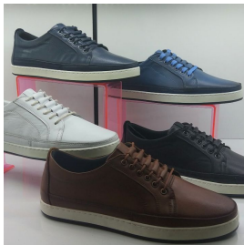
Produkt Herren Lederschuhe