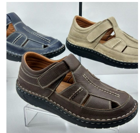
Produkt Herren Lederschuhe