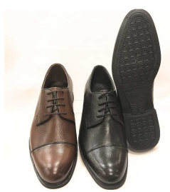
Produkt Herren Lederschuhe