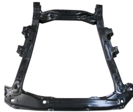
Produkt Motor Beşığı