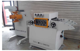
Produkt SERVO SÜRÜCÜLÜ DOĞRULTMA PRES BESLEME HATTI