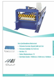
Produkt RULO ŞEKİLENDİRME MAKİNELERİ