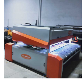
Produkt HALI YIKAMA MAKİNESİ