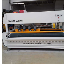
Produkt HAV ALMA-SÜPÜRME MAKİNESİ