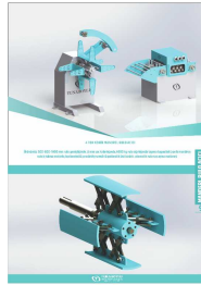
Produkt 4 TON KONİK MANDREL RULO AÇICI