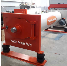
Produkt HALI SIKMA MAKİNESİ