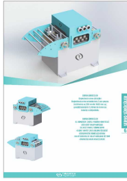
Produkt SERVO SÜRÜCÜ