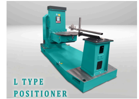
L TYPE POSITIONER