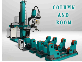
COLUMN AND BOOM