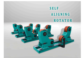
SELF ALIGNING ROTATOR