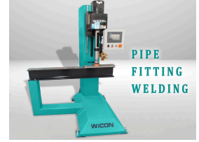
PIPE FITTING WELDING