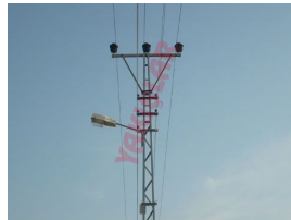
Produkt A Pfosten