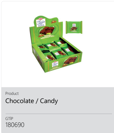
Product Chocolate / Candy