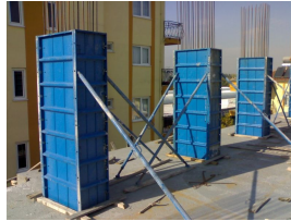
Product Construction Molds