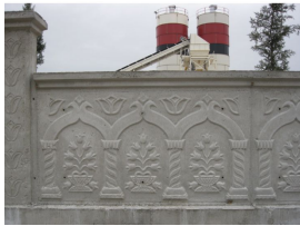
Product Garden Wall Molds