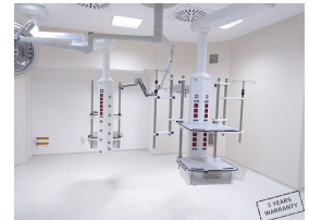
Product Operating Room Service Unit