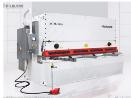
Product CNC Hydraulic Guillotine