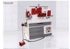
Product Hydraulic Combined Scissors