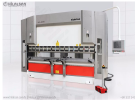
Product CNC Hydraulic Press