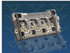
Product Cylinder Head