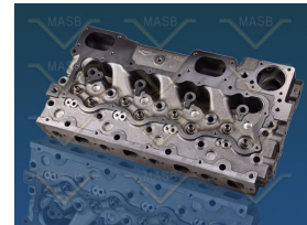
Product Cylinder Head