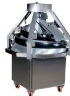
Product Dough Mixing Machine