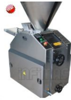
Product Dough Cutting Weighing Machine -