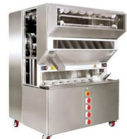
Product Dough Maturing Machine