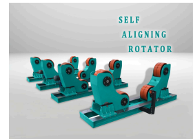
SELF ALIGNING ROTATOR