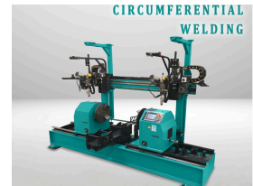
Product Circumferential Welding Machine