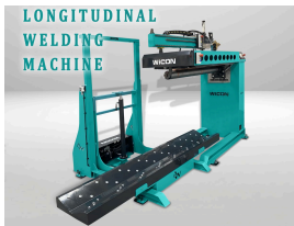
Product Longitudinal Welding Machine