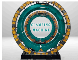
Product Clamping Machine