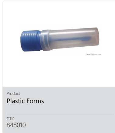
Product Plastic Forms