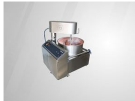
Product Turkish Delight Cooking Machine