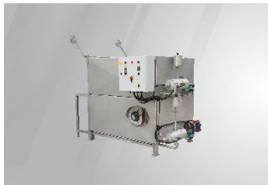
Product Oil Melting Couldron