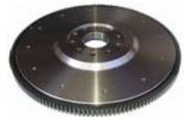
Producto Engranaje de Volante