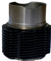
Producto Camisa de Motor