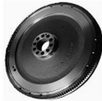
Producto Engranaje de Volante