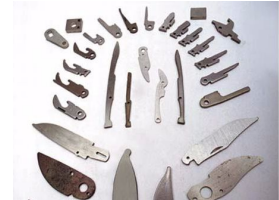
Producto Piezas de Repuesto de Automotor