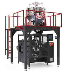
Producto IM-W ÇOKLU ELEKTRONİK TERAZİLİ PAKETLEME MAKİNESİ