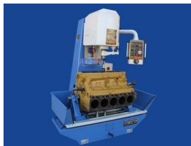
Producto Rectificadora Hidráulica