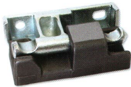
Producto Bisagra de Escotilla Lateral