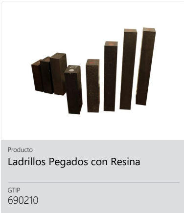
Producto Ladrillos Pegados con Resina