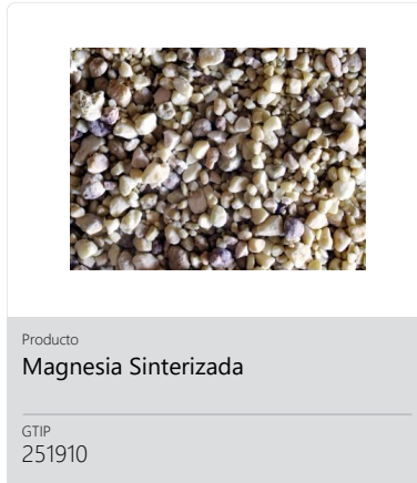
Producto Magnesia Sinterizada