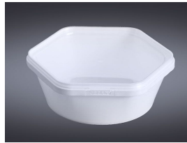
Producto Contenedor de plástico