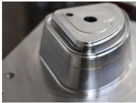
Producto Molde Fundido