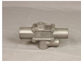
Producto Productos de fundición