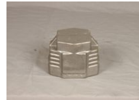
Producto Productos de fundición