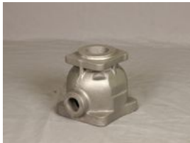
Producto Productos de fundición