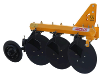
Produit CHARRUE À DISQUE