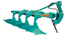
Produit CHARRUE ENTIÈREMENT AUTOMATIQUE À RÉGLAGE