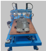
Produit Machine de centrage automatique