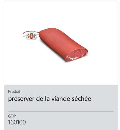
Produit préserver de la viande séchée