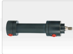
Produit Vérin Hydraulique