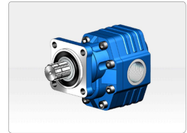
Produit Pompe à Engrenage