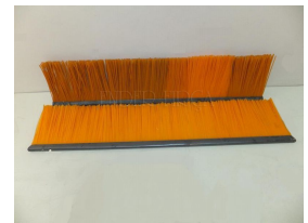
Produit Brosse à peignes