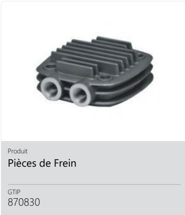
Produit Pièces de Frein