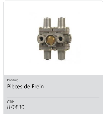
Produit Pièces de Frein