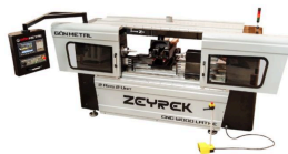
Produit MACHINE CNC BOIS 2 AXES