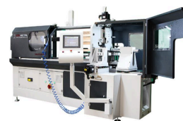
Produit TOUR DE VITESSE SIRAYET (ROVELVER)