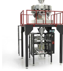
Produit BM-W MACHINE D'EMBALLAGE AVEC PESEUSE MULTI-TÊTES