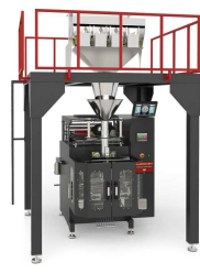
Produit IM-L MACHINE DE CONDITIONNEMENT AVEC PESEUSE