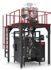
Produit IMQ-W MACHINE DE CONDITIONNEMENT À JOINT