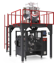
Produit IM-W MACHINE D'EMBALLAGE AVEC PESEUSE MULTI-TÊTES