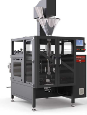
Produit IM-A MACHINE D'EMBALLAGE AVEC REMPLISSEUR DE TARIÈRE