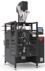
Produit IMQ-A MACHINE DE CONDITIONNEMENT À JOINT