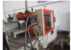
Produit Machine de seconde main