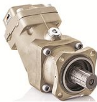
Produit Pompes Axiales Piston