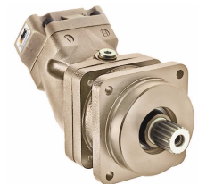
Produit Chemise de Piston de Moteur à Combustion Interne