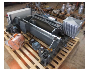
Produit grue portail