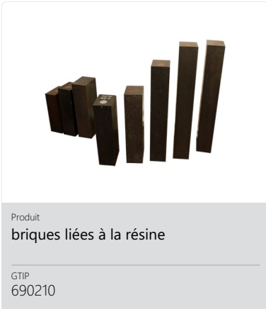
Produit briques liées à la résine