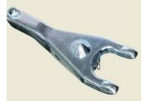
Produit Coupleur d'embrayage