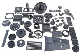
Produit IMAGES DES PIECES SPHERO