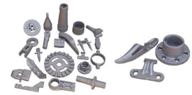
Produit GROUPE DE COULÉE EN ACIER - INSTRUMENTS AGRICOLES,