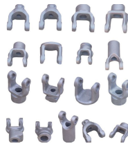
Produit GROUPE DE MOULAGE EN ACIER - JOINTS