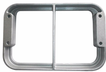
Produit Moulage d'Aluminium