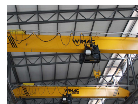
Produit Grue à un seul rail